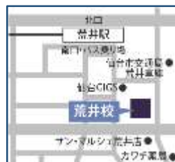
若林区荒井東一丁目4-7