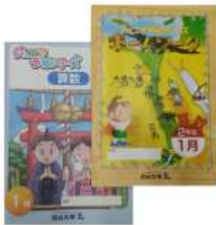
【使用教材】 ・「ジュニア予習シリーズ」

四谷大塚のオリジナル教材「ジュニア予習シリーズ」と「ホームワーク」を使用し、中学受験に向けて本格的な準備を行います。授業と毎日の「ホームワーク」を活用し、基本的な学習習慣の定着だけでなく、「考える習慣」の獲得を目指していきます。