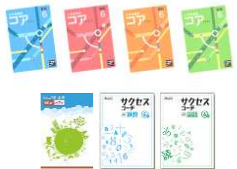
【使用教材】 ・「コア」 ・「ジュニア新演習」 ・「サクセスコーチ」

アドバンスコースは、各教科のより発展的な内容や次の学年の先取りなど、学年にとられない学習をしていきたい方にお勧めするコースです。講師によるモチベーションアップのための声かけも行い、お子さまの知的好奇心を高めていきます。