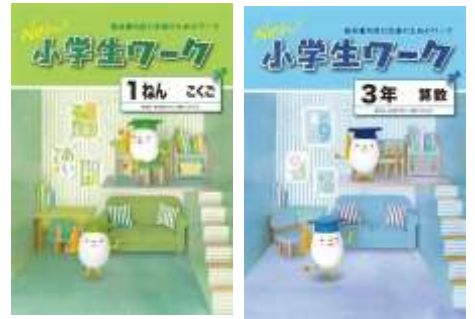
【使用教材】 ・「小学生ワーク」など

学校対応コースでは、小学校の進度をふまえ、その内容をしっかりと理解できるように強力にサポートしていきます。学校の宿題を持ち込んで、授業の中で進めることも可能です。教務力に長けたTOPPA館講師陣が、お子様の定着度を確認しながらポイントを押さえてアドバイスをしていきます。